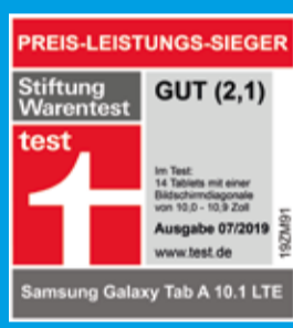
GalaxyTab A 10.1 (LTE), gut (2,1), 7/2019.

Auch erhältlich mit LTE: Galaxy Tab A 10.1 LTE (2019) 64GB für je 299,-€