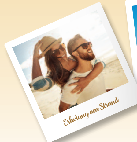
Erholung am Strand

Schnell sein lohnt sich! Zimmer-Upgrade für die ersten 50 Bucher! 1)