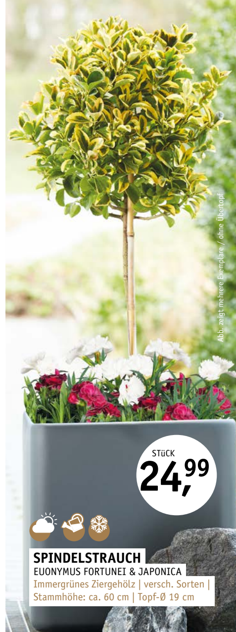
Abb. zeigt mehrere Exemplare / ohne Übertopf