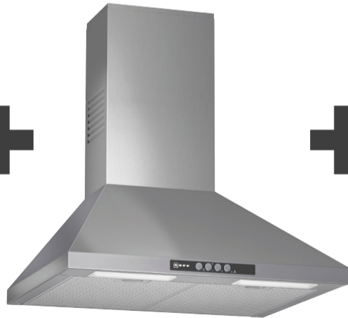
Wandesse „DPBC620N“, EEK D* 52