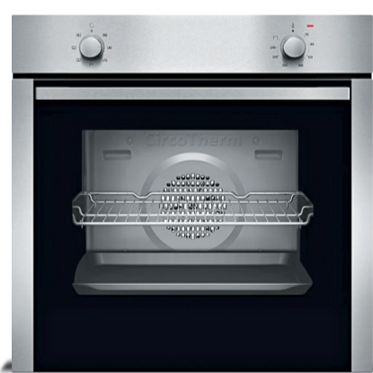
Backofen „BCA 1502“, EEK A* 51