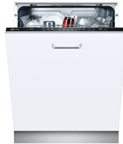
Vollintegrierter Geschirrspüler „GV 1400 A“, EEK A+* 51