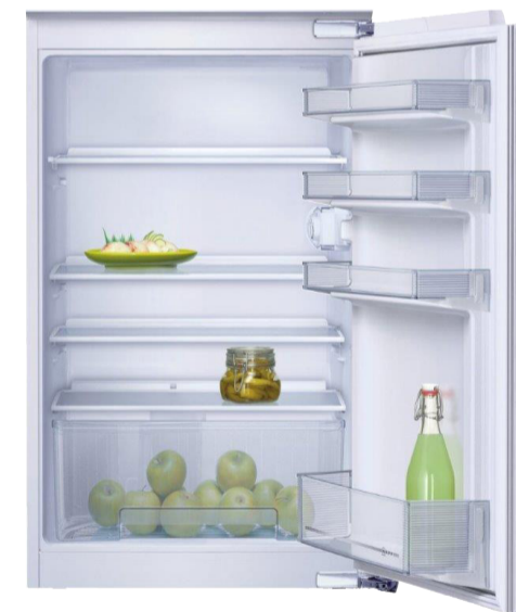
Einbaukühlschrank „K215A2“, EEK A++* 51

*4 Gültig beim Kücheneinkauf während der Küchentage. *51 Spektrum der verfügbaren Energieeffizienzklassen A+++ bis D *52 Spektrum der verfügbaren Energieeffizienzklassen A++ bis E