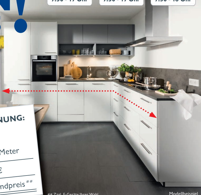
## Zzgl. E-Geräte Ihrer Wahl.

METER-VERKAUF SAMSTAG 22.+01. FEBRUAR/MÄRZ 9.30 - 18 Uhr