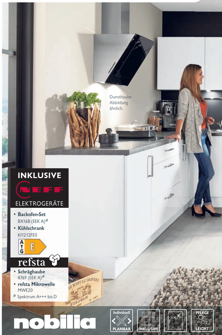
Dunsthaube Abbildung ähnlich.