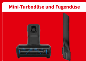
Mini-Turbodüse und Fugendüse