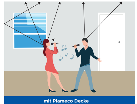
mit Plameco Decke