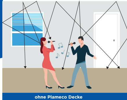
ohne Plameco Decke