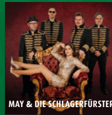
MAY & DIE SCHLAGERFÜRSTER